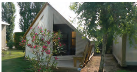
Lodge junior - 4 places

Cette lodge comprend une chambre lit double, et une chambre de deux lits simples. Les oreillers et les couettes sont fournis.