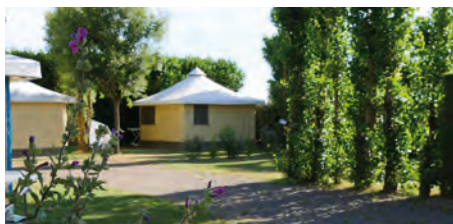
Bungalow Toilé - 5 places

Ce bungalow comprend une cuisine, un salon de jardin, une chambre lit double, et une chambre de deux lits superposés. Les oreillers et les couettes sont fournis.