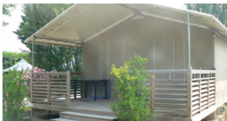
Lodge - 5 places

Cette lodge comprend une chambre lit double, et une chambre de trois lits simples. Les oreillers et les couettes sont fournis.