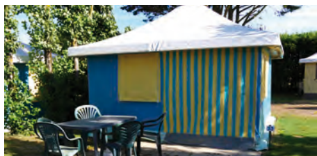
Bungalow Toilé - 4 places

Ce bungalow comprend une cuisine, un salon de jardin, une chambre lit double, et une chambre de deux lits simples. Les oreillers et les couettes sont fournis.